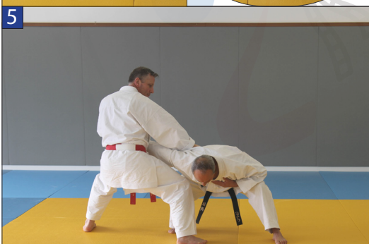
Tori repasse devant Uke pour enchaîner une clé ventrale inversée en position kiba-dashi et frappe Tetsui avec la main droite.