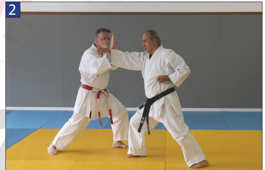
Uke attaque Tori en oi-zuki jodan. Tori esquivé vers l'extérieur et pare l'attaque avec un double contact de la main gauche puis de la main droite.