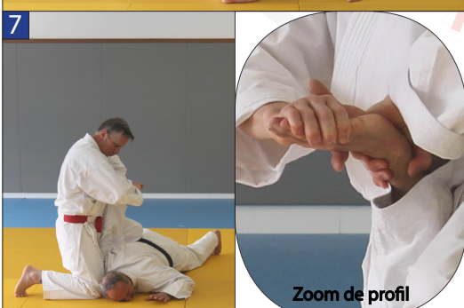
Tori immobilise Uke avec une torsion de poignet sur le plan horizontal.