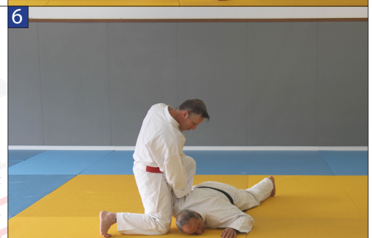
Tori emmène Uke au sol en exerçant une pression vers le bas au niveau de son coude.