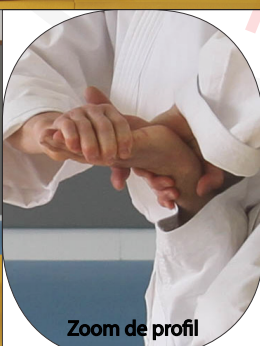
Zoom de profil