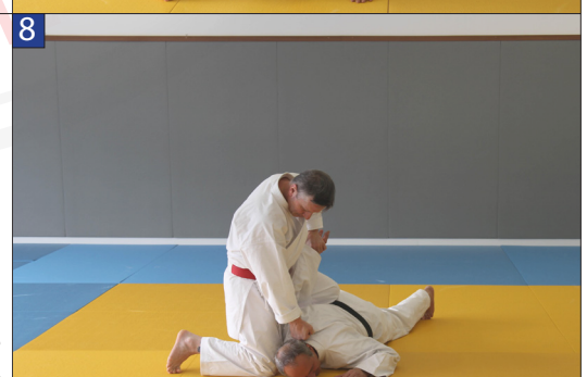
Tori termine sa technique avec un Oi-zuki droit au niveau de la nuque de Uke.