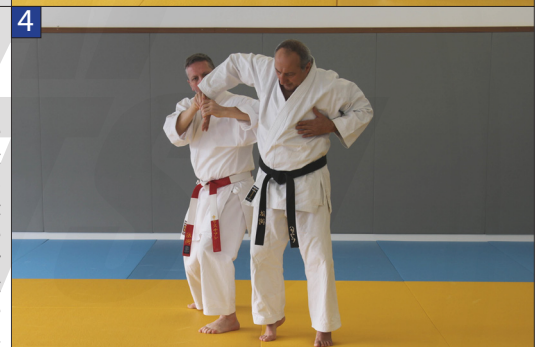
Tori engage une rotation à droite et passe sous le bras de Uke. Tori met en place une clé en faisant pivoter le poignet droit de Uke sur l'axe vertical.